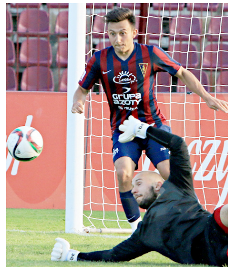
Juniorzy starsi Pogoni Szczecin w świetnym stylu wywalczyli srebrne medale mistrzostw Polski. Rewanżowy mecz z Legią Warszawa zgromadził na Twardowskiego ponad 5500 widzów!