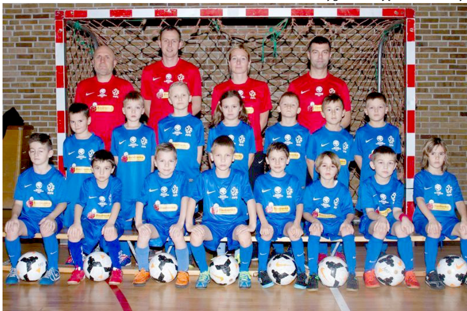
AMO Szczecin-Żaki 2