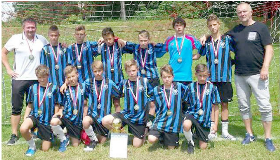
W czerwcu młodzi piłkarze Bałtyku Koszalin grając w barwach Szkoły Podstawowej nr 7 wywalczyli wicemistrzostwo Polski szkół podstawowych.