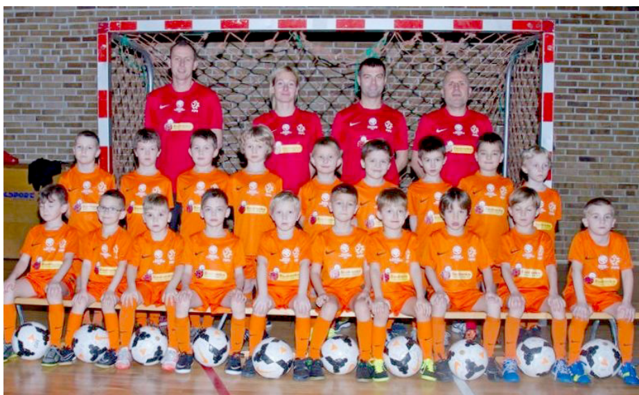
AMO Szczecin-Skrzaty 1,2

- Z dużym zainteresowaniem śledzę rozwój szczecińskiej Akademii Młodych Orłów. To pio-