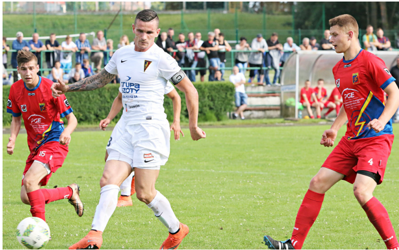
O tym, że piłkarze Energetyka cieszą się w regionie uznaniem najlepiej świadczy fakt, że Pogoń właśnie z ekipą z Gryfina rozegrała pierwszy sparing w letnim okresie przygotowawczym.

- Jesteśmy zadowoleni ze współpracy z prezesem, wszystko mamy zapewnione. Nie ma