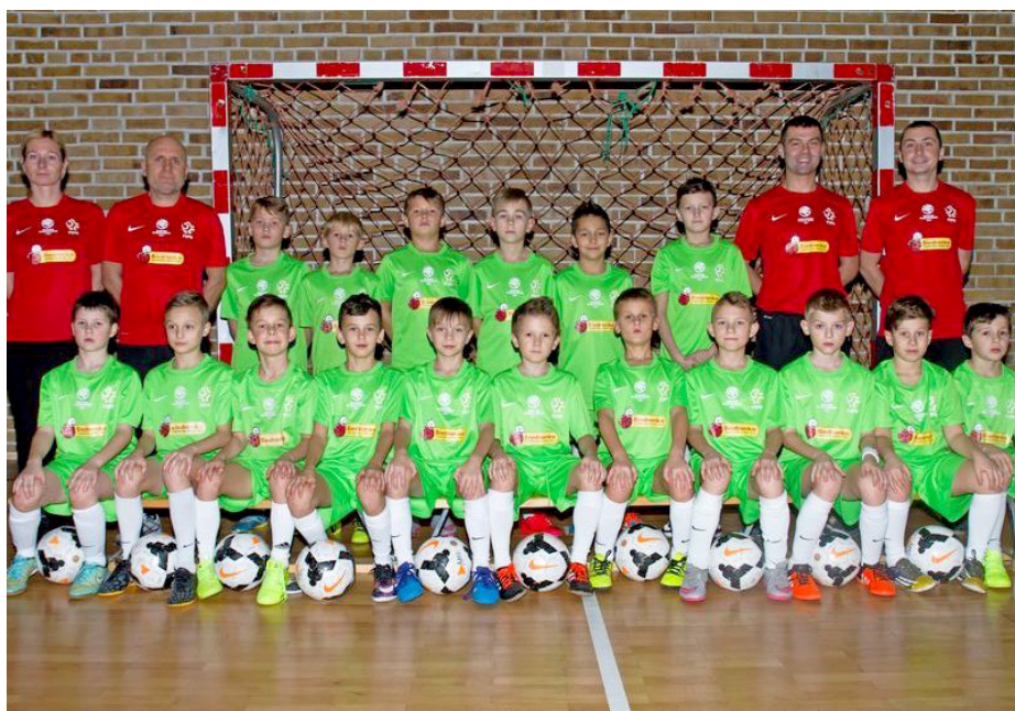
AMO Szczecin-Orliki 1