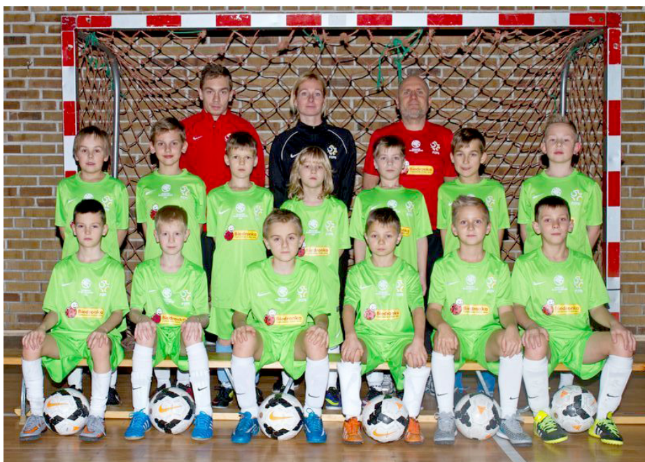
AMO Szczecin-Orliki 2