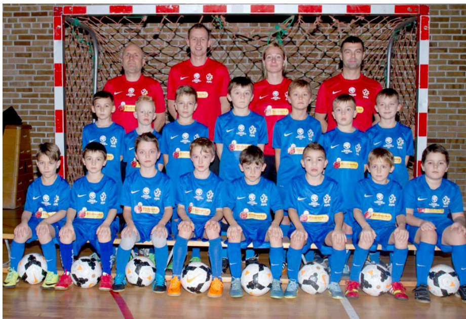
AMO Szczecin-Żaki 1