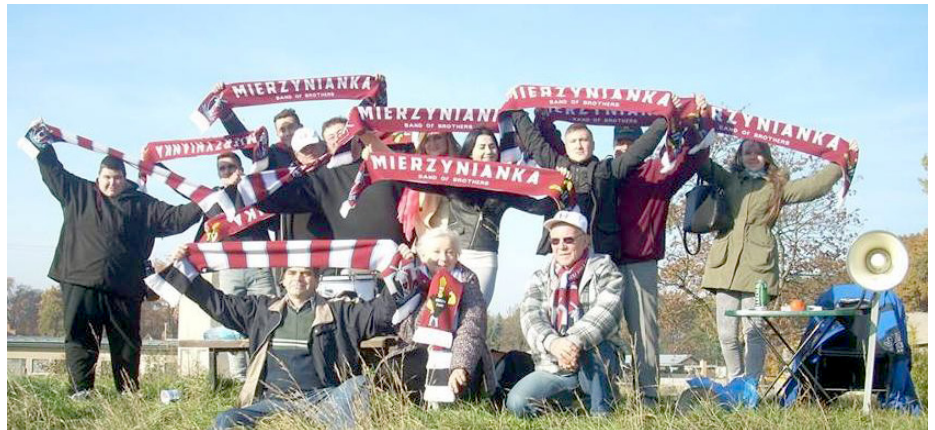
Piłkarze Mierzynianki mają grupę wiernych kibiców, którzy za swoim zespołem jeździli na mecze wyjazdowe.

- Kto z perspektywy całego sezonu najbardziej przyczynił się do awansu.