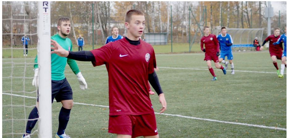
Po rozegraniu rundy jesiennej wszystkie reprezentacje ZPN zachowały szansę na awans do finałowych rozgrywek.

M.S.: Pogoń jest marką samą w sobie i naturalnie, że jest to absolutny lider w naszym regionie. Dzieje się jednak bardzo dużo dobrego w innych klubach. Rocznik 2003, który w jesiennych meczach wypadł ze wszystkich najlepiej, składa się mniej więcej po połowie z piłkarzy Pogoni i Football Aca-