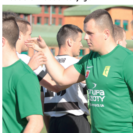
Piłkarze Chemika mają jasno sprecyzowany cel. Jest nim awans do IV ligi.

- Oczywiście. To jest nasz cel. Ale spokojnie z rozbudzeniem nadziei. W klubie wszyscy zdajemy sobie sprawę z faktu, że awansować do czwartej ligi jest niewspółmiernie łatwo w porównaniu do awansu z czwartej do trzeciej ligi. Police to jednak tak znacząca aglomeracja, że futbol na poziomie trzeciej ligi powinien u nas funkcjonować.