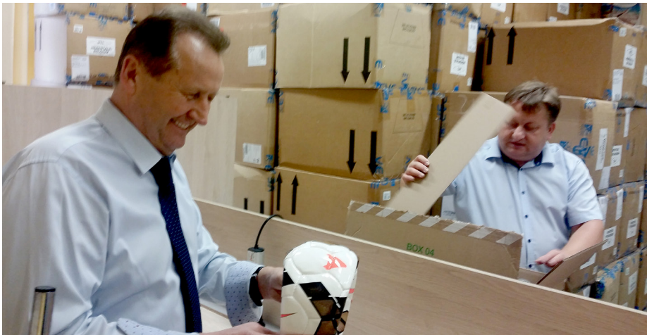
W listopadzie sala konferencyjna w siedzibie ZZPN zamieniła się w magazyn wypełniony kartonami z piłkami.

ZZPN rozdaje sprzęt sportowy. Sześć tysięcy piłek systematycznie trafia do klubów. W lutym przekazane zostaną też bramki dla najmłodszych piłkarzy